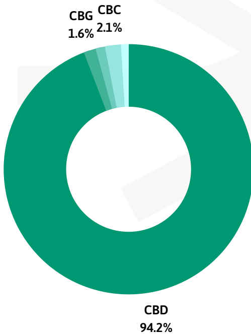
PERFIL DE CANNABINOIDES

Método Interno Basado en "DAB 2018 Cannabisblüten" (U-HPLC)