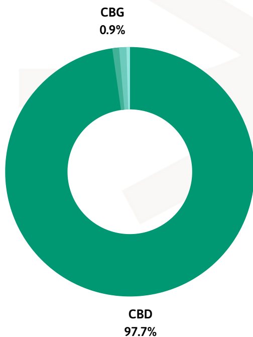
PERFIL DE CANNABINOIDES